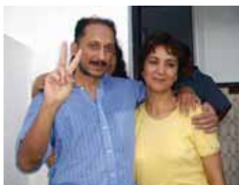
Mohammed Abbou y su esposa tras la excarcelación de éste en julio de 2007.

En abril de 2005, el abogado y defensor de los derechos humanos, Mohammed Abbou , fue condenado a tres años y medio de prisión en un juicio injusto por publicar en internet artículos críticos con el gobierno. Fue puesto en libertad el 24 de julio de 2007 junto con otros 21 presos políticos con motivo del cincuentenario de la República de Túnez.