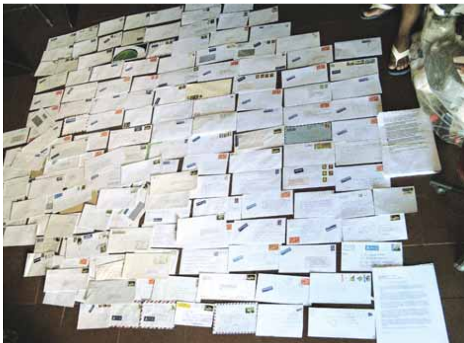
Cartas de apelantes atendiendo a una Acción Urgente

una manifestación. Varios agentes de policía la sacaron de una furgoneta y le propinaron numerosos golpes y puntapiés. Luego la esposaron, le cubrieron la cabeza y la obligaron a tumbarse sobre otros detenidos en el interior de un vehículo que estaba esperando. Los agentes la amenazaron reiteradamente con matarla "como a un perro".