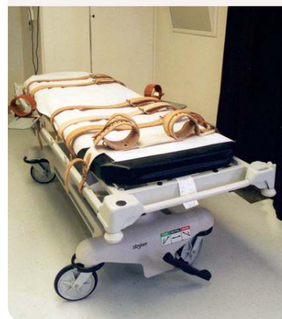
Sala i llitera preparades per a l'aplicació de la injecció letal.