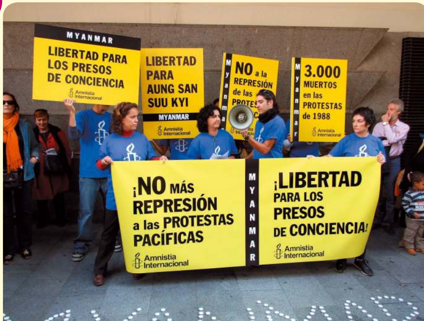
Acte de protesta contra la repressió de manifestacions pacífiques a Myanmar. Amnistia Internacional van demanar, a més, la posada en llibertat de totes les persones preses de consciència.

El cap de Policia està sotmès a una pressió creixent per trobar els responsables de l'explosió del Parc del Mil·lenni. L'alcalde, els responsables de negocis perjudicats en l'assumpte del Parc del Mil·lenni i l'opinió pública reclamen accions immediates per evitar un altre atac.