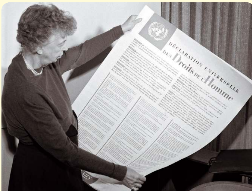
Eleanor Roosevelt, esposa del President dels Estats Units, diplomàtica i activista pels drets humans, sostenint la Declaració Universal dels Drets Humans.