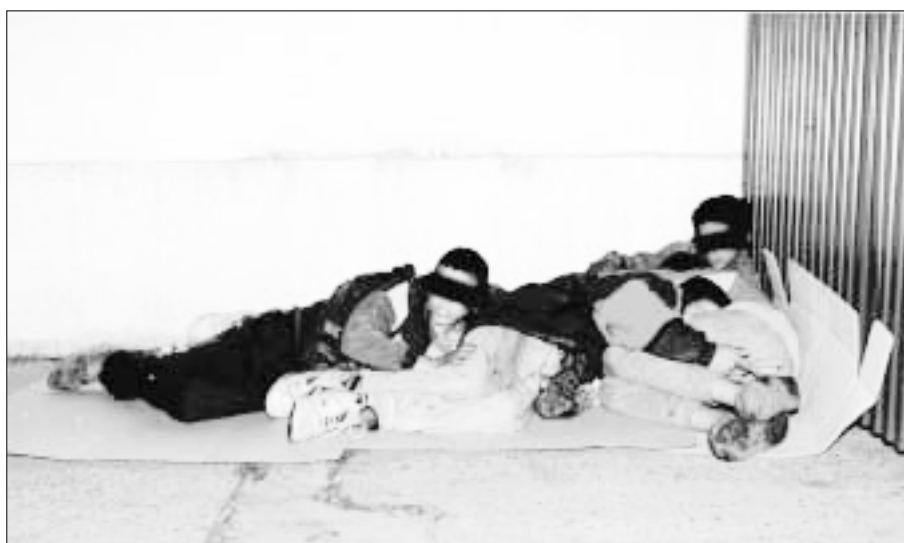
Niños no acompañados de adultos en Ceuta. © Julián Rojas